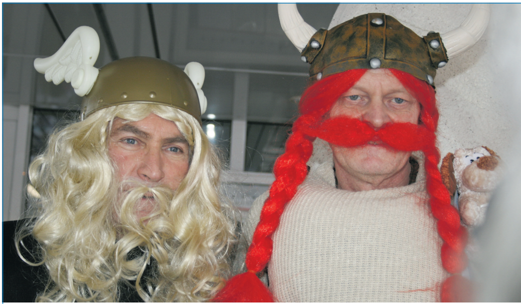
Asterix und Obelix im letzten Jahr zu Gast in Völklingen