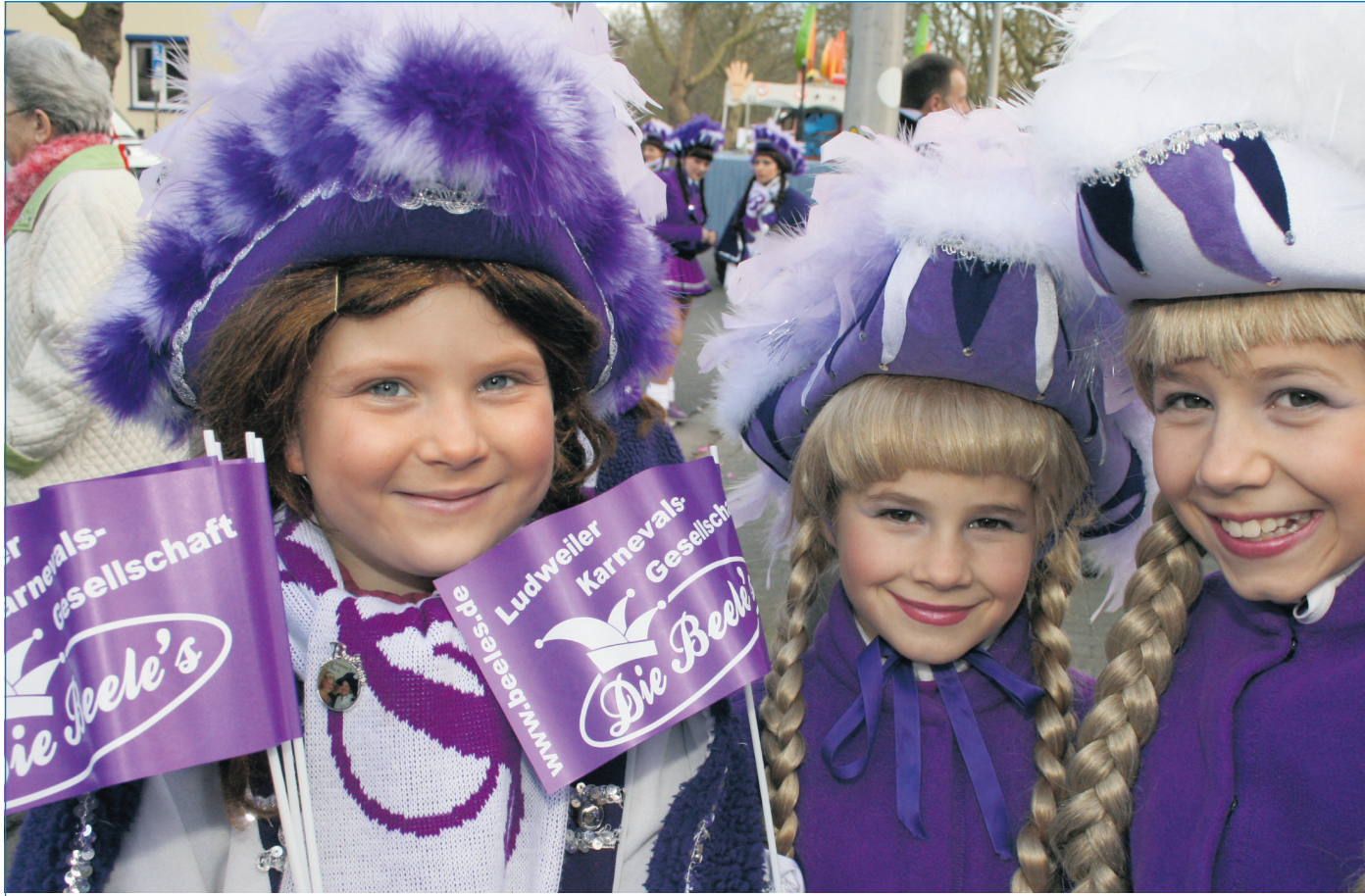
Die Vorfrende auf die närrische Jahreszeit ist bei den Jüngsten riesengroß

Für unverlangt eingesandte Artikel übernimmt die Redaktion keine Haftung.