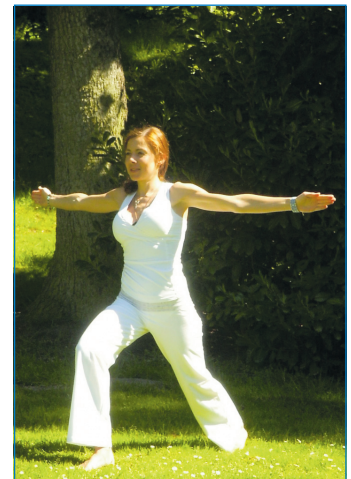
Indian Balance

Röschling, inszeniert bei einer Kundgebung vor dem Alten Rathaus. Wer schon immer mal Theater spielen wollte, ist bei den VHS-Theatergruppen gut aufgehoben. Jürgen Reitz inszeniert mehrere Stücke pro Jahr, die im Alten Bahnhof zur Aufführung kommen. Neben den Grundlagen-Kursen zur Textverarbeitung, Tabellenkalkulation und Präsentation im Fachbereich EDV stehen Seminare zum Google-Universum, Umgang mit dem i-Phone oder Android-Smartphone auf dem Programmplan. Wer sich einen neuen PC angeschafft hat, bekommt Tipps und Hilfe.